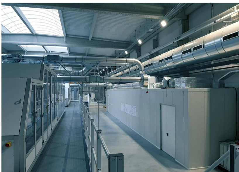
IHS Induction Humidification System

Il suo background ingegneristico permette di trovare soluzioni su misura adatte ad ogni azienda, rispettando le esigenze e le normative specifiche per ogni settore industriale.