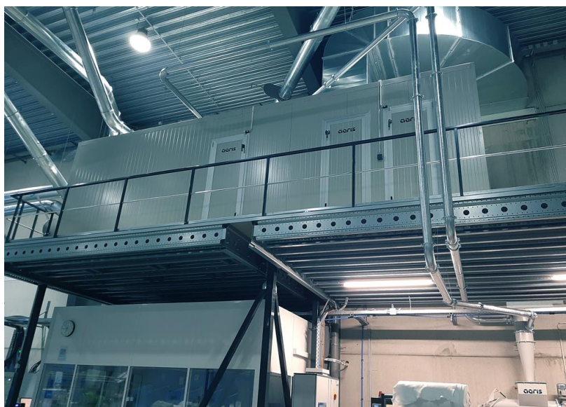
Impianto di filtrazione polveri e fibre

Partendo dall'aspirazione, filtrazione e rimozione di fibre e cascami e passando attraverso sistemi di umidificazione a miscela dell'aria, gli impianti di MAZZINIICI garantiscono il raggiungimento delle condizioni termo-igrometriche richieste da ogni processo produttivo con il minor consumo elettrico ed idrico.